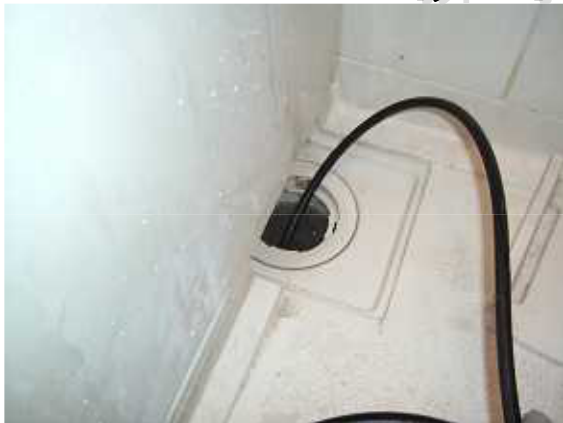
↓ ユニットバス排水管